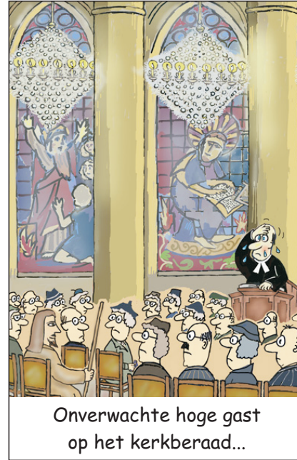
Onverwachte hoge gast op het kerkberaad...