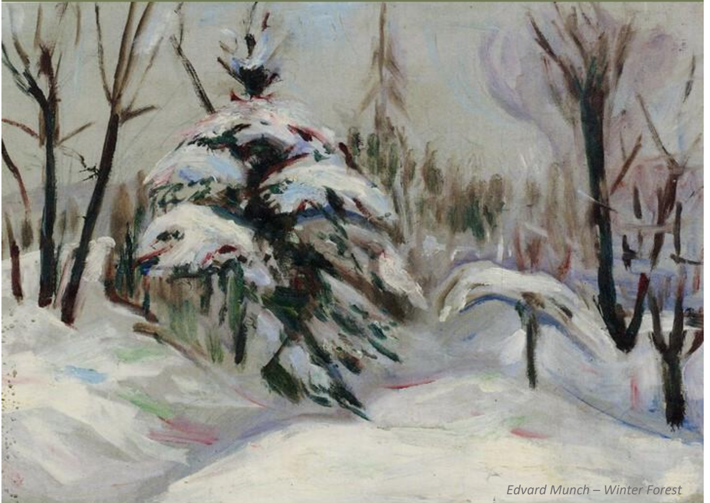
Edvard Munch – Winter Forest