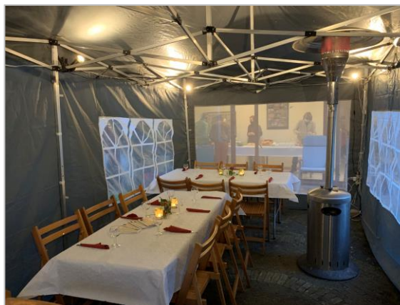
Tentmodel 'Jesaja - medium' - tot 20 personen Voorgesteld tijdens het Fonteinfoest 2021

En ik begin alvast aan het cursiefje van april, onder de werktitel: 'Gods volk onderweg: file aan Brussels Expo'.