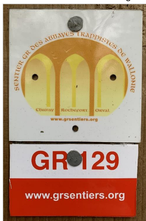
Mens sana in corpore sano: langs GR129 ontdek je het allemaal

Wie had ooit gedacht dat Filosofenfontein perfect past in het rijtje van moderne fitnesscentra?