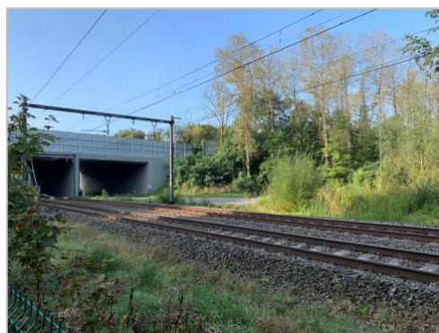
Stopt hier binnenkort de Fonteinexpress?

Misschien moeten we als Kapelgemeenschap in het kader van ons thema klimaatrechtvaardigheid een initiatief lanceren om met de trein naar de kapel te komen. De spoorweg ligt er al. Een biodiverse berm ook. Enkel het station ontbreekt. Terwijl Infrabel werkt aan de nodige infrastructuur, kunnen wij ons concentreren op de zoektocht naar een mooie naam. Laat ons even een lijstje overlopen op zoek naar verdere inspiratie. Sinds de Fonteinkwis weten we dat we voor het Vaticaan moeten afstappen in 'Stazione del Vaticano'. Dat vind ik weinig origineel. In Vlezenbeek vinden we station 'Heilige Geest', een busstation. 'Oude God' is ook bekend, maar volgens mij niet echt respectvol. 'Het einde van de wereld' is een treinstation in Argentinië. Dichterbij vinden we 'de Middenstatie'. Dat is niet halverwege de 14 staties van de kruisweg, maar wel een andere naam voor Antwerpen Centraal. Dat station wordt met de typische Antwerpse overdrijving ook de 'Spoorwegkathedraal' genoemd. Nu, we hebben nog even de tijd: zo snel is Infrabel niet met beslissen en investeren.