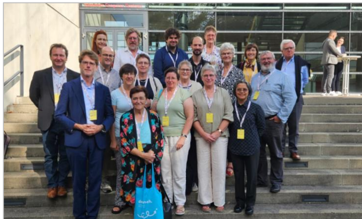
De Vlaamse delegatie in Hannover