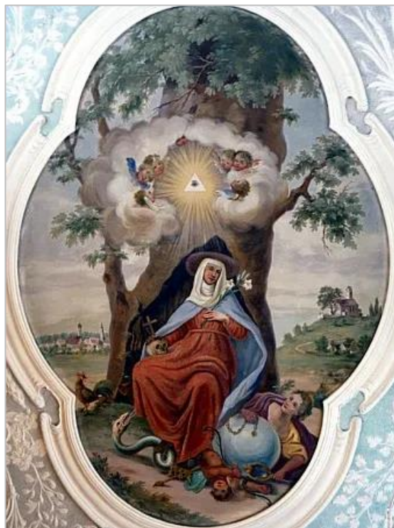
Edigna van Puch, hier met een lelie. Zij wordt soms ook afgebeeld met ossenkar, haan of klok. Allemaal voorwerpen, verloren door Gods volk onderweg. De eigenaars mogen zich melden op edigna@allsaints.org

Bron: (*) https://www.vrt.be/vrtnws/nl/2024/01/09/verloren-voorwerpen-nmbs/#:~:text=Er